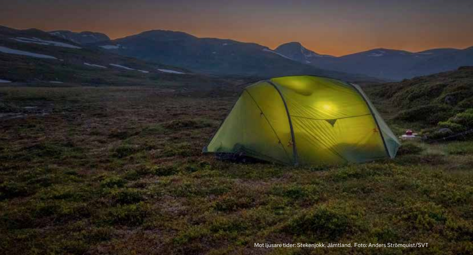
Mot ljusare tider: Stekenjokk, Jämtland.

SVT ska ta ett aktivt ansvar för att bidra till en långsiktig hållbar utveckling när det gäller klimat- och miljöfrågor.