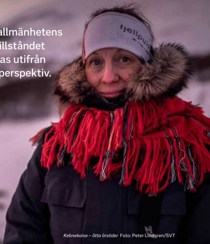
Kebnekaise – åtta årstider

— SVT ska bedriva tv-verksamhet i allmänhetens tjänst. I enlighet med sändnings-tillståndet ska programverksamheten bedrivas utifrån ett jämställdhets- och mångfaldsperspektiv.