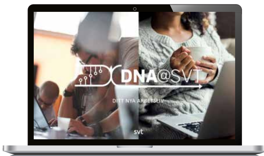
Våren 2021 initierades projektet "Ditt nya arbetsliv"

Coronapandemin driver nya arbetssätt och digitala lösningar har blivit en självklarhet. Våren 2021 initierades projektet "Ditt nya arbetsliv" där chefer och medarbetare tillsammans identifierade och utvecklade sätt att leda för en mer hållbar arbetsmiljö både på plats, på distans och en ny inriktning med fokus på hybridarbete.