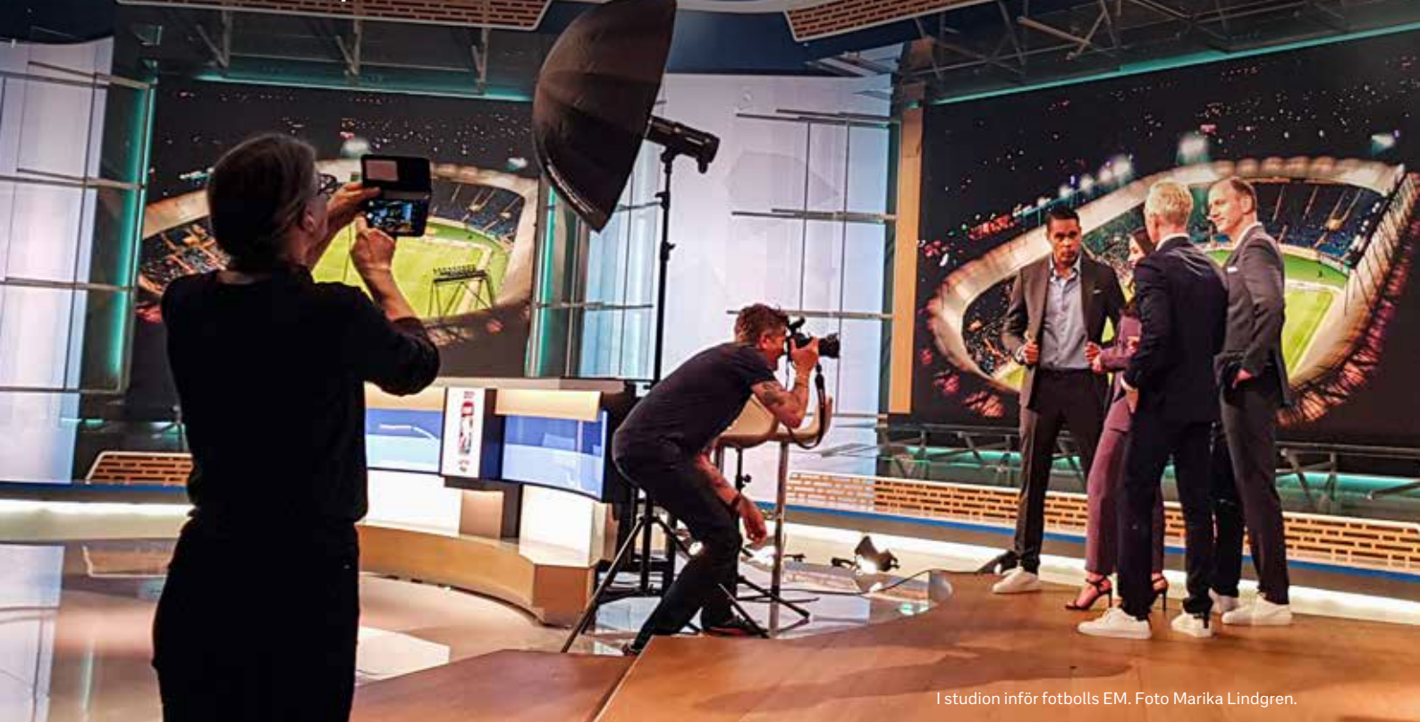
I studion inför fotbolls EM.

SVT:s verksamhet ska präglas av oberoende och stark integritet och bedrivs självständigt i förhållande till såväl staten som olika ekonomiska, politiska och andra maktsfärer i samhället.