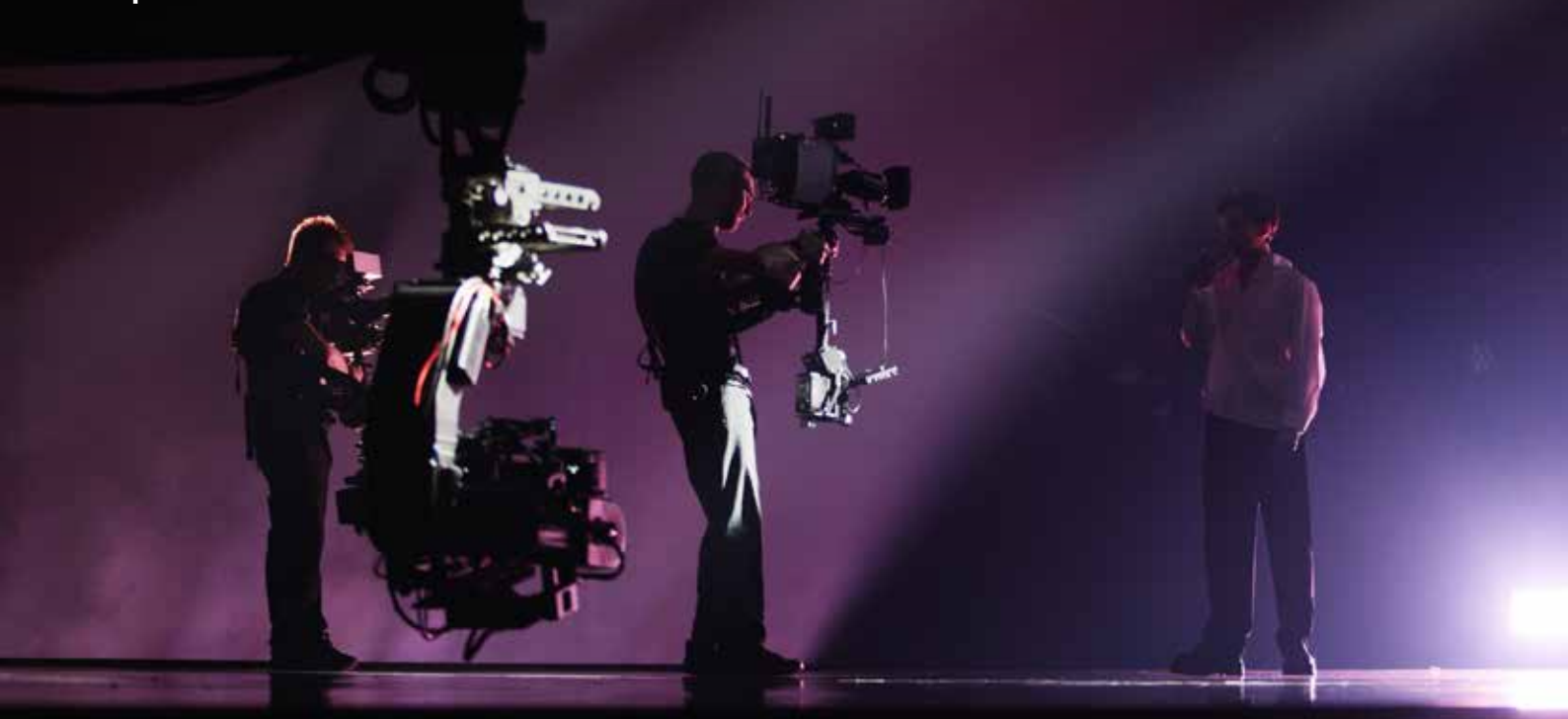
Melodifestivalen med Rejhan.

SVT:s verksamhet ska präglas av oberoende och stark integritet och bedrivs självständigt i förhållande till såväl staten som olika ekonomiska, politiska och andra maktsfärer i samhället.