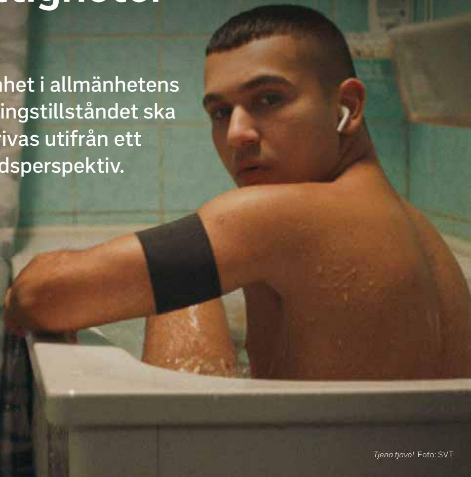
Tjena tjavo!

— SVT ska bedriva tv-verksamhet i allmänhetens tjänst. I enlighet med sändningstillståndet ska programverksamheten bedrivas utifrån ett jämställdhets- och mångfaldsperspektiv.